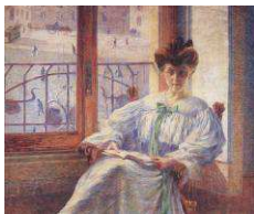
Umberto Boccioni, La signora Massimino , 1908, collezione privata

INGRESSO LIBERO fino a esaurimento posti disponibili