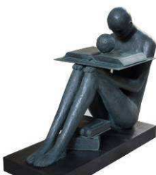
Mimmo Paladino, La Conoscenza , bronzo, 2015. La statua è stata realizzata per il 90° anniversario dell'Istituto della Enciclopedia Italiana ed è esposta presso il Padiglione Zero di Expo 2015