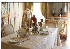
Il Salottino dorato con la tavola imbandita